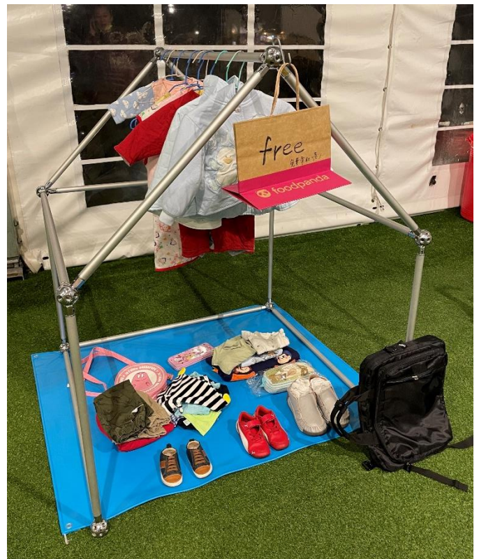
圖 2 頂棚、展架示意圖(L100×W100×H140)