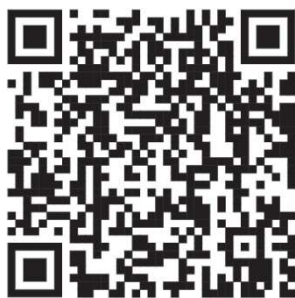
115 年度線上登記報名表