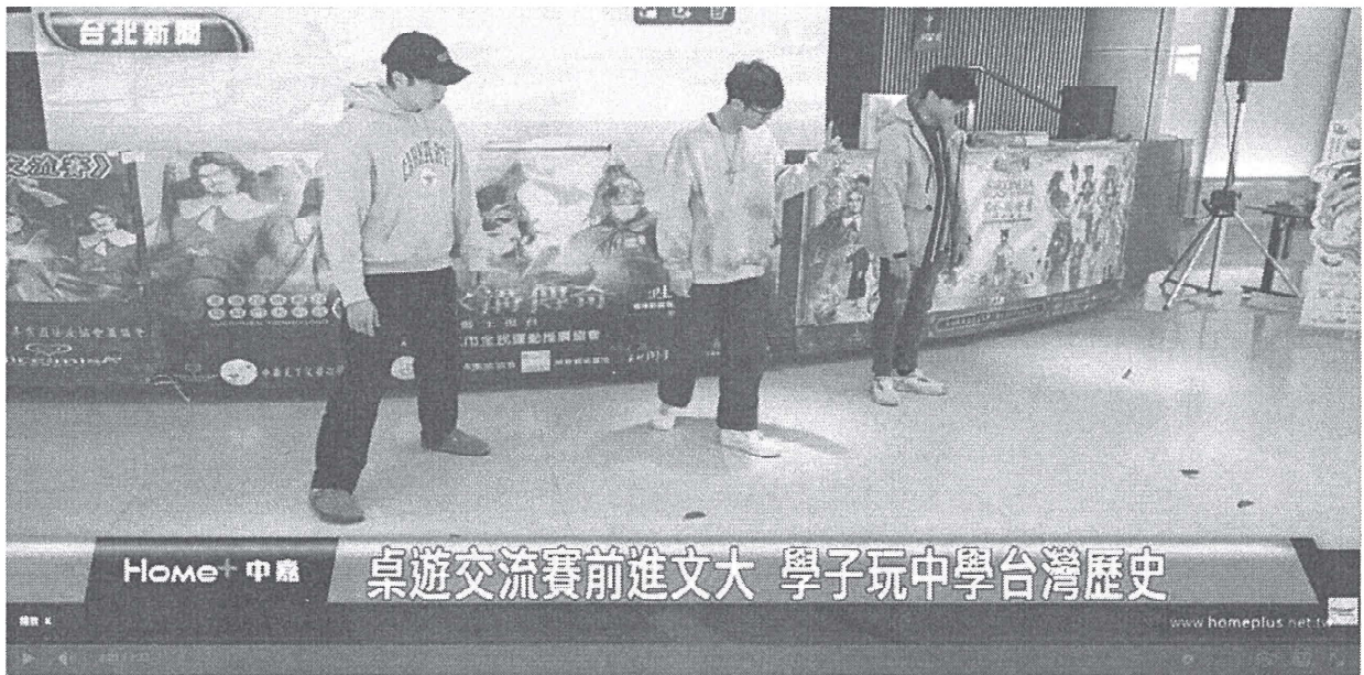
桌遊交流賽前進文大 學子玩中學台灣歷史